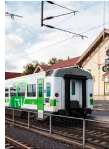
ESTACIÓN DE TREN

Calle de una ciudad con edificios altos y bajos. En la calle habrá transeúntes y curiosos.